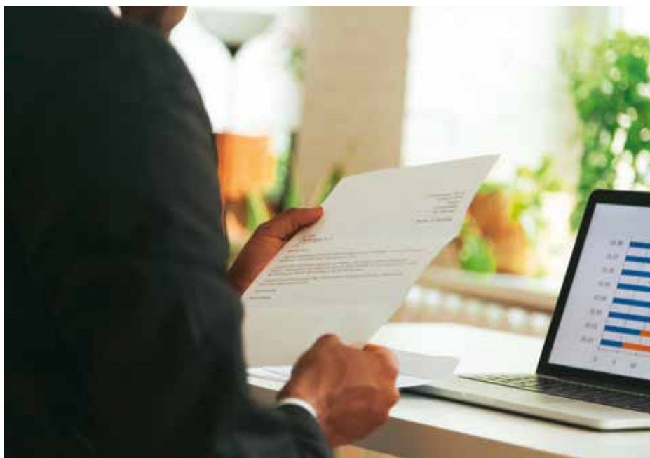
Attention aux fautes d'orthographe dans les lettres de motivation.