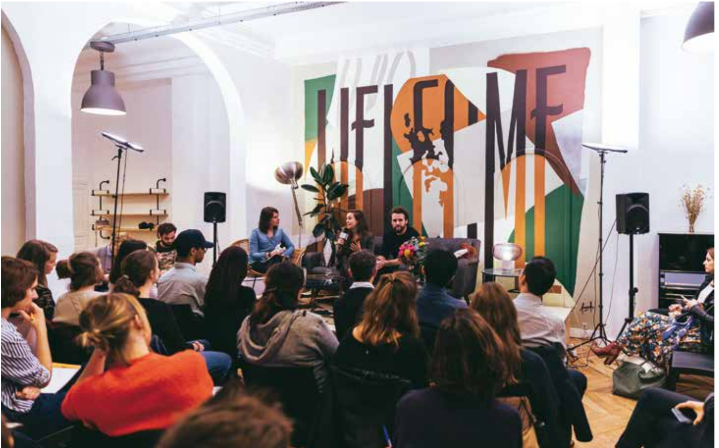
Un évènement «Boost», organisé par Welcome to the jungle.