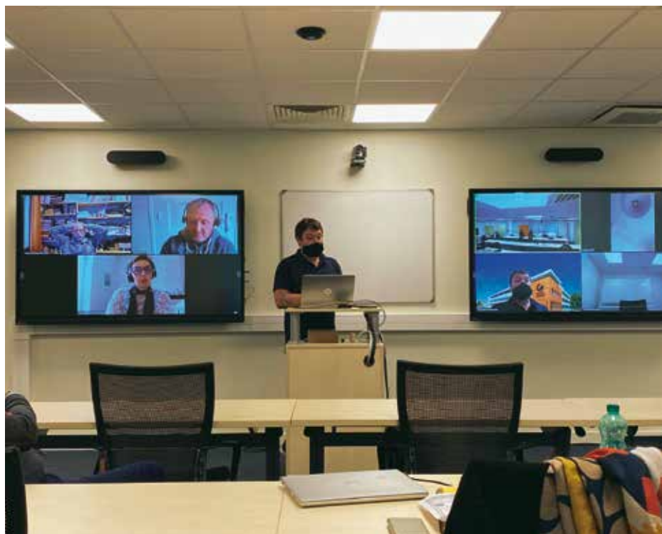
Grenoble EM a créé des salles « Hyflex ».

Face à l'urgence de la situation, la grande majorité des établissements suspend les cours durant une semaine pour mieux préparer la transition vers le 100 % distanciel. En quelques jours, il faut s'organiser, faire le choix des outils ou les déployer, acheter des licences pour certains logiciels, mettre en place des formations et des tutoriels, proposer une assistance