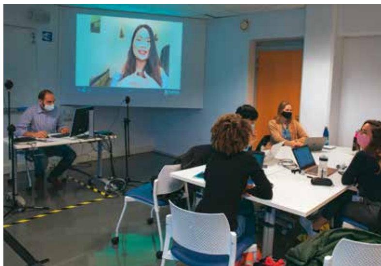
Un matériel adéquat permet de rendre le distanciel moins contraignant. Ici, la vidéo permet aux étudiants du cours hybride, qu'ils soient présents ou chez eux, de se voir mutuellement et ainsi de se sentir impliqués dans le cours.