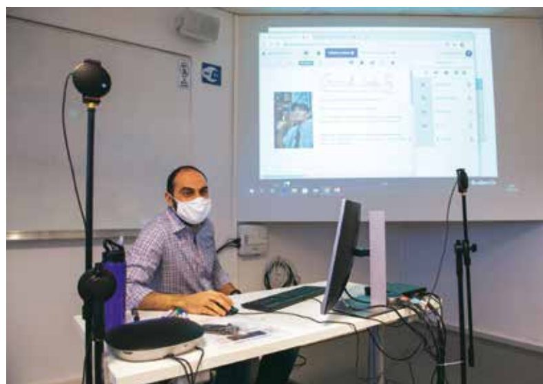
L'enseignant dispose de deux micros sur trépied devant son bureau, ainsi que d'un haut-parleur sur ce dernier, pour obtenir un son optimal. Les étudiants à distance sont ainsi entendus de tous.