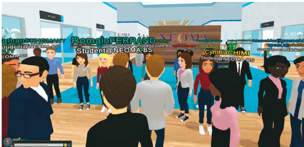
L'un des halls du bâtiment virtuel de Neoma, propice aux rencontres informelles.

leurs fonctions. Pour le reste, les équipes dédiées à la transformation digitale, en lien avec le corps professoral, ont opté pour tel ou tel outil en fonction de différents critères : accessibilité, sécurité, taux d'adoption, prix, etc.