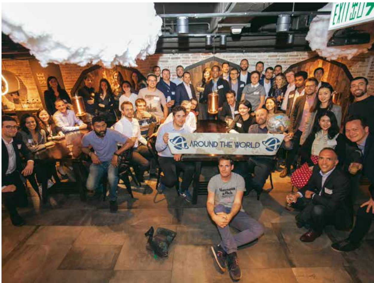
L'opération d'Audencia "Around the World" a permis de créer des ponts entre chaque pays dans lesquels les diplômés sont établis.