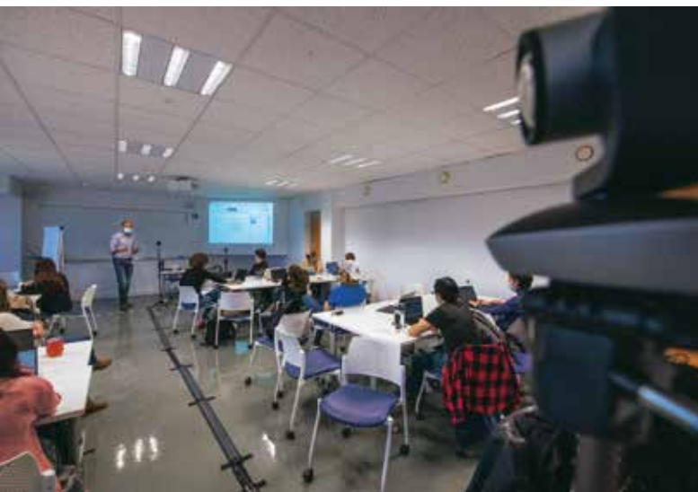
Au fond de la salle, la caméra sur son trépied est oubliée de tous. Seul l'enseignant va pouvoir la faire pivoter à distance selon l'angle souhaité et préalablement enregistré.