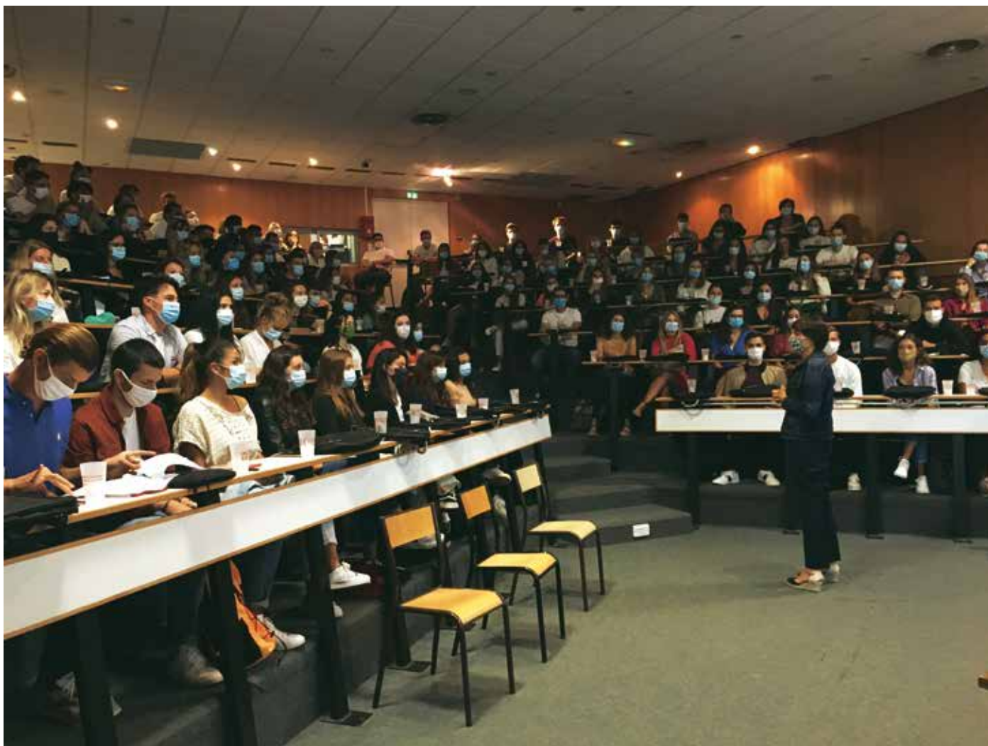
Une rentrée «masquée» à l'IAE Aix-Marseille.