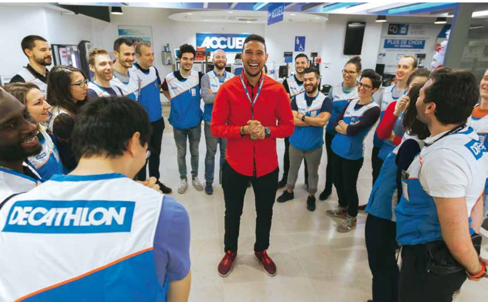
Chez Decathlon, 20% des leaders de magasins sont issus de l'alternance.