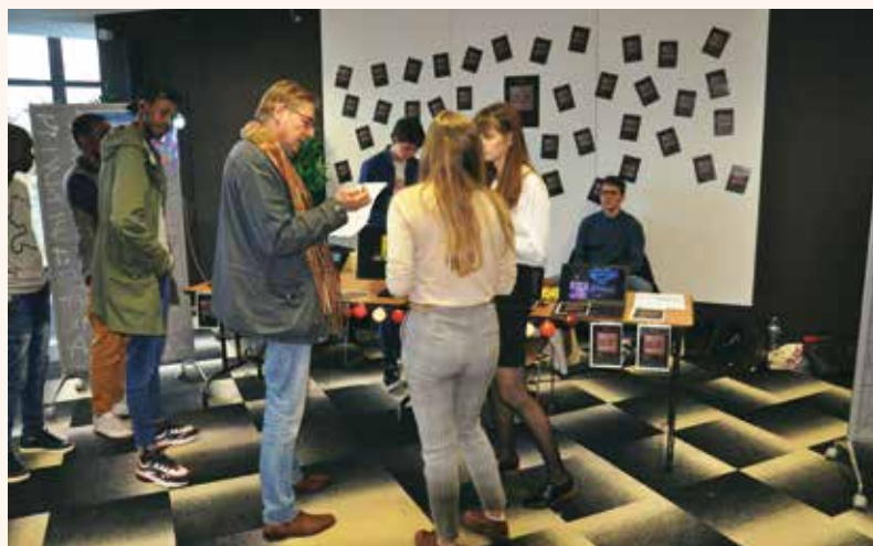
Étudiants de l'IAE et en L3 informatique de l'Université de Caen présentant leur projet de logiciel de karaoké à un acheteur potentiel, ici un enseignant, lors du « faux » salon de crowdfunding, le 3 mars 2020.